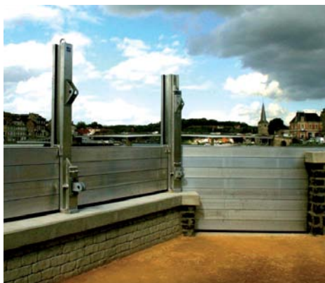
Protections amovibles en cours de montage

Les palplanches sont fichées à 4 ou 5 m de profondeur et jusqu'à 7 m pour les plus profondes selon la zone de travaux.